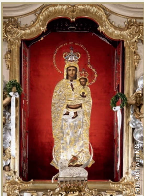
Sanktuarium Maryjne w Górcie Klasztornej