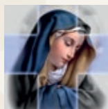
Apostolstwo Dobrej Śmierci – Górcza Klasztorna

Nr konta bankowego: 26 8938 0006 0000 1759 2000 0012